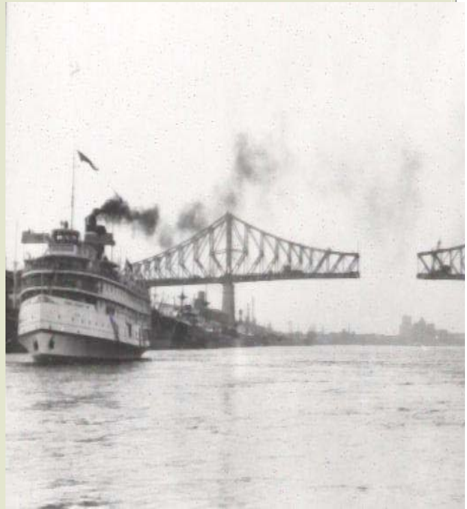
Le pont Jacques-Cartier en construction en 1929 Pour en savoir plus sur le pont Jacques-Cartier

Plaque commémorative indiquant l'année de construction