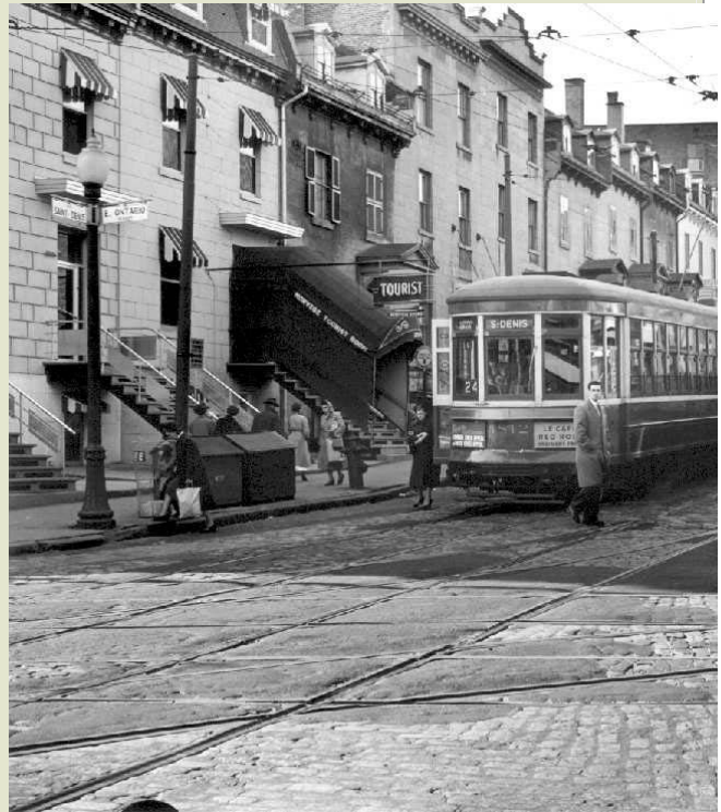
Un tramway au coin de Saint-Denis et Ontario en 1953