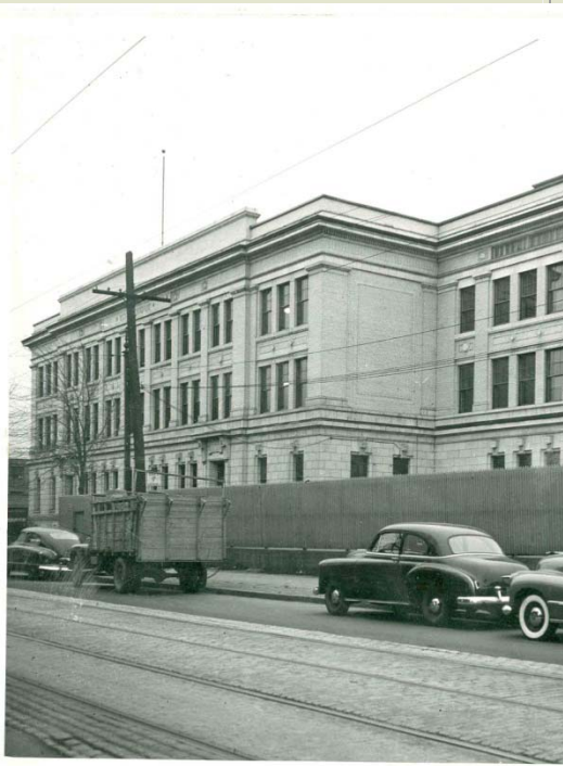
Des voitures garées sur Papineau dans les années 1950