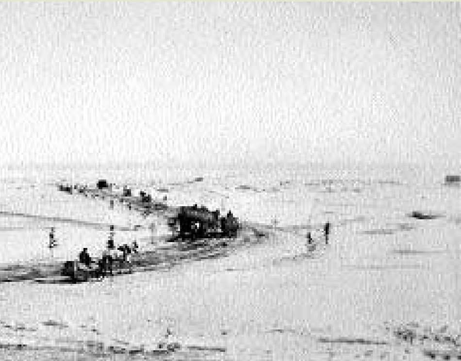
et Saint-Lambert dans les années 1930

Encore dans les années 1950 , on livrait lait, beurre, fromage, oeufs et glace pour vos glaciers